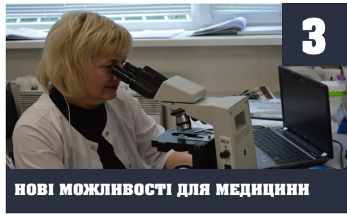
НОВІ МОЖЛИВОСТІ ДЛЯ МЕДИЦИНИ