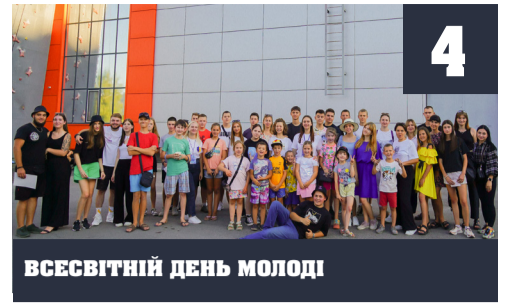
ВСЕСВІТНІЙ ДЕНЬ МОЛОДІ