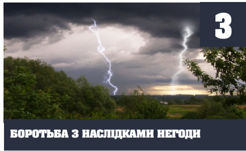
БОРОТЬБА З НАСЛІДКАМИ НЕГОДИ